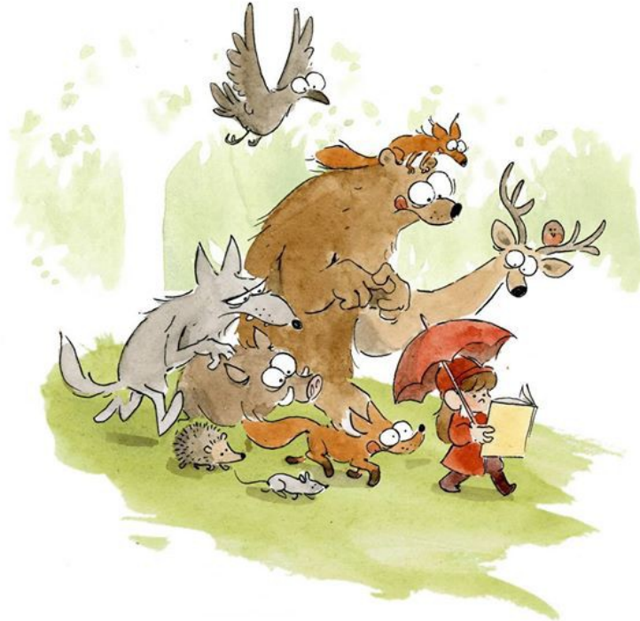
Illustration: Benjamin Renner